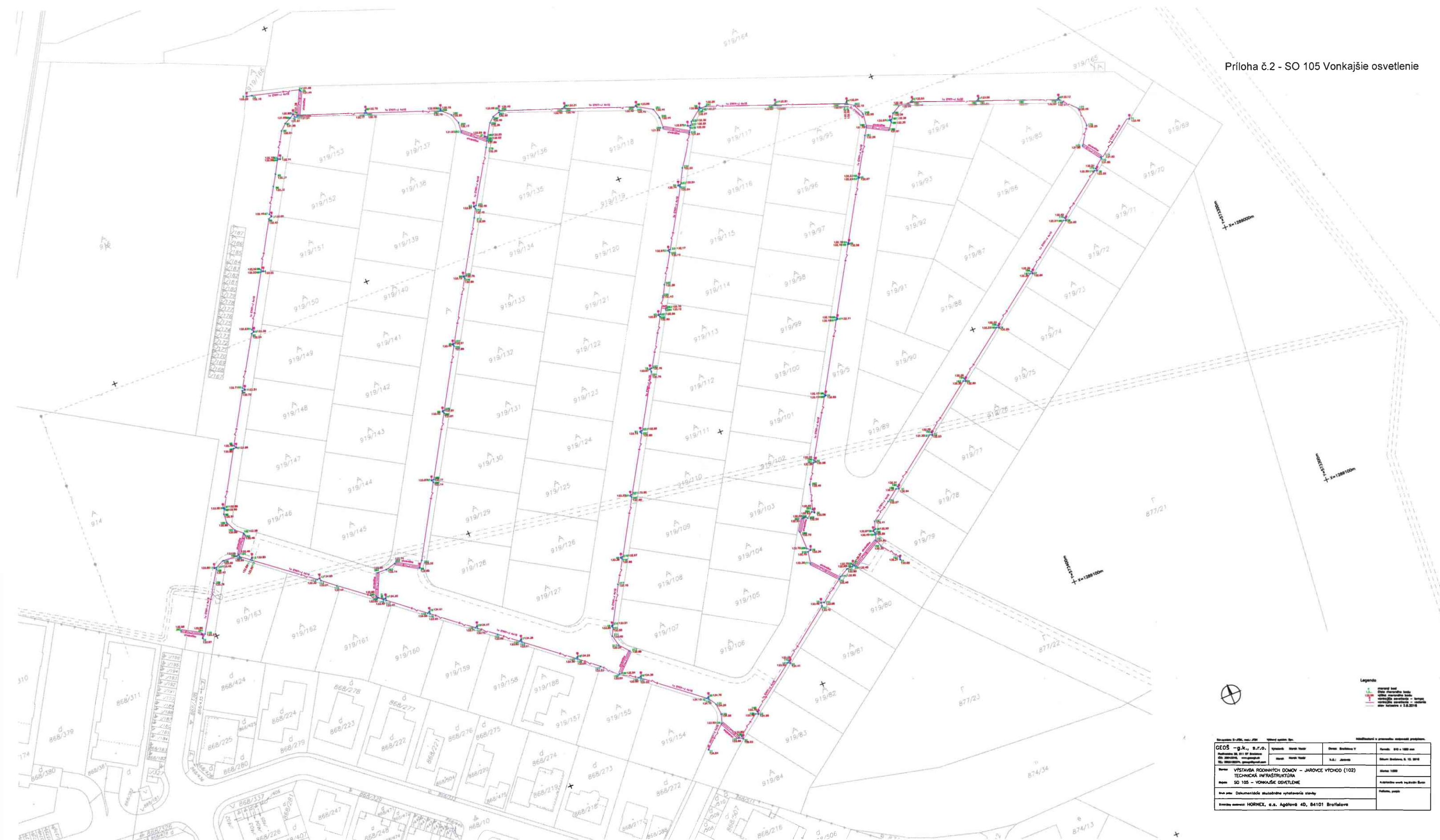
Príloha č.2 - SO 105 Vonkajšie osvetlenie