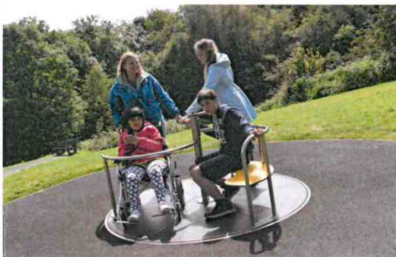
Príklady vybavenia bezbariérového ihriska pre deti na vozíku