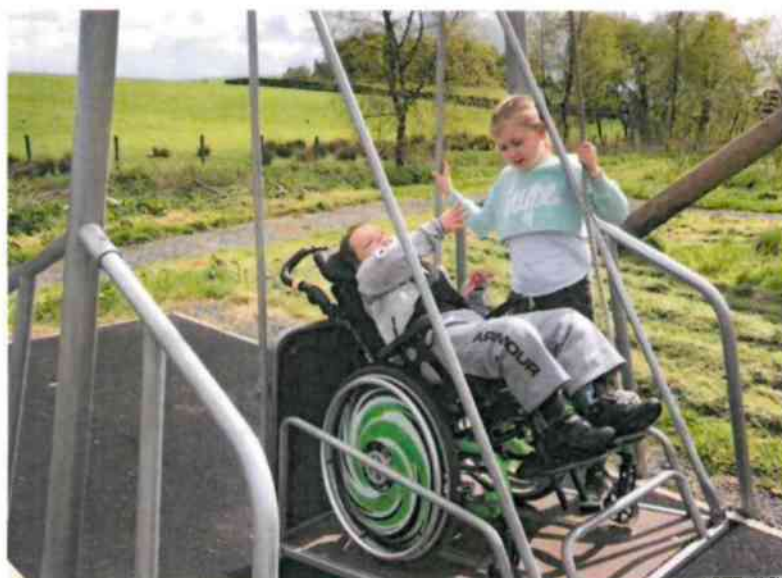
Príklady vybavenia bezbariérového ihriska pre deti na vozíku