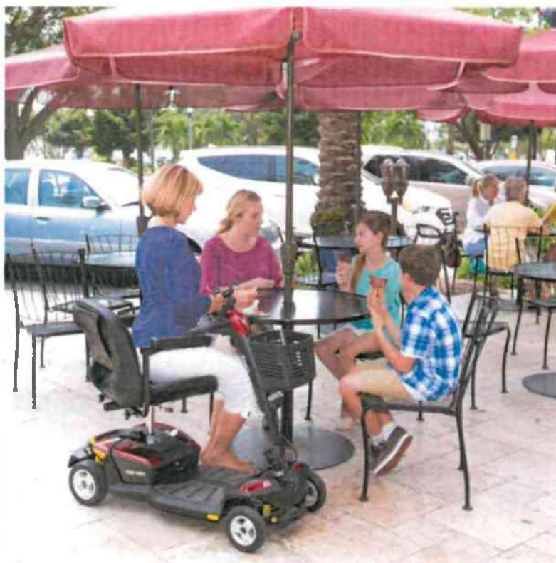
Dobrý príklad sedenia pre ľudí na vozíku – stôl s nohou uprostred