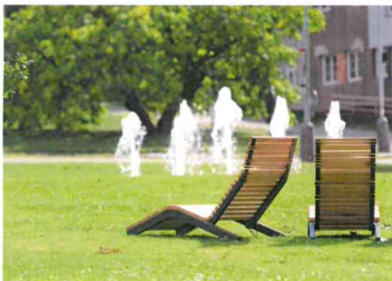
Nevhodný tvar a výška sedenia pre ľudí s pohybovým postihnutím a starších ľudí