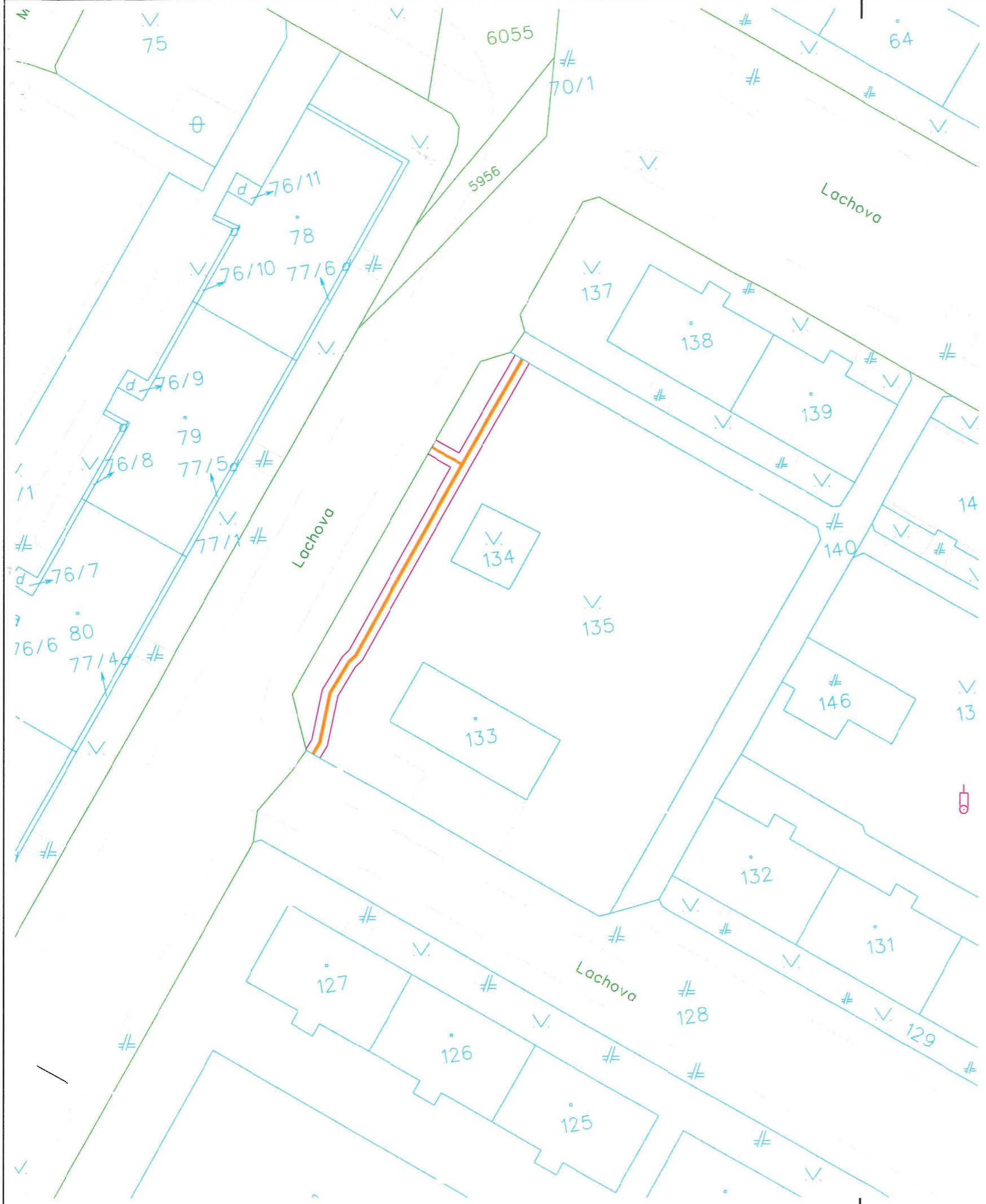
Mapa širších vzťahov