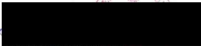
Dana Čahojová starostka