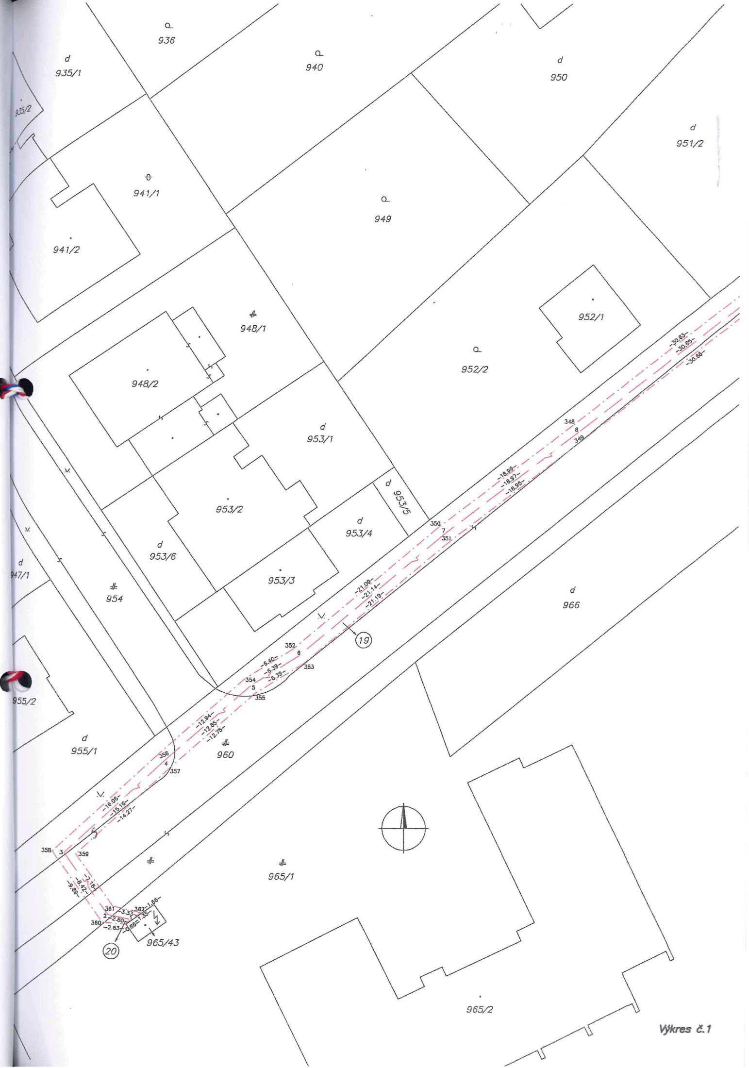
Vykres č. 1