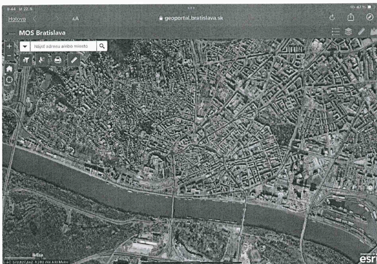
Príloha č. 1: snímka z mapy optickej infraštruktúry MOS-HMBA