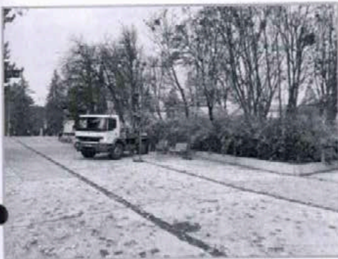
Fotodokumentácia 1, 2, 3, 4

Podľa inžiniersko - geologickej rajonizácie územia Slovenska náleží skúmaná oblasť k regiónu neogénnych tektonických vklesnín, oblasť vnútrokarpatských nížin, rajón pleistocénnych riečnych ter s , s prevažne plesčitými zeminami (HRAŠNA, 1988).