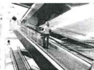
Eskalátory & pohyblivé chodníky