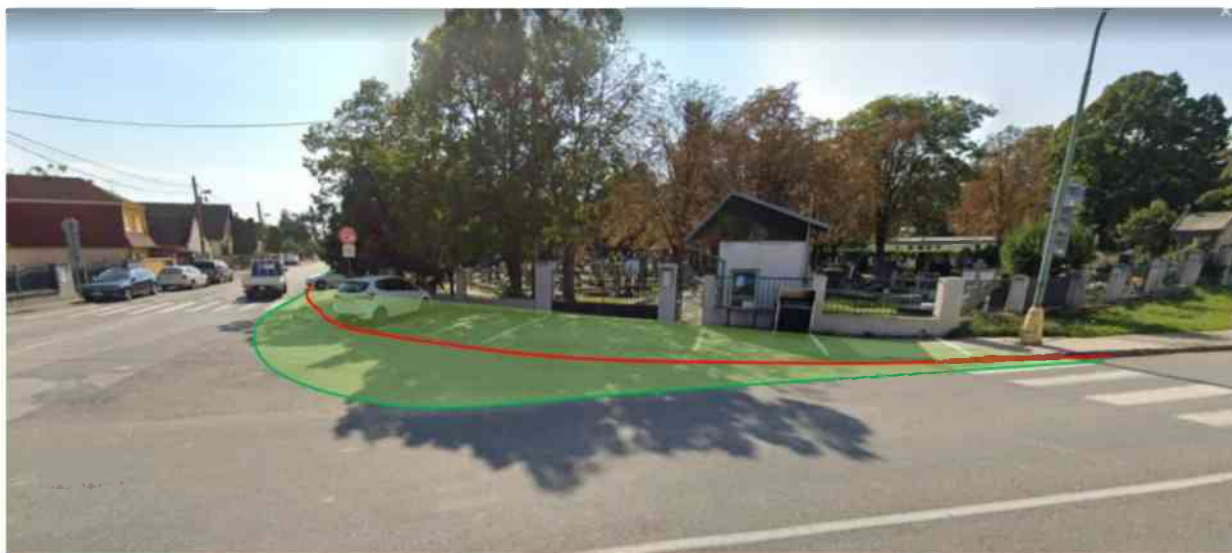
Obrázok 2. Navrhovaná úprava pred vstupom do cintorína v nároží križovatky Mramorová-Šamorínska

Vysvetlenie: zelenou nová plocha pre chodcov, červenou pôvodná plocha pre chodcov