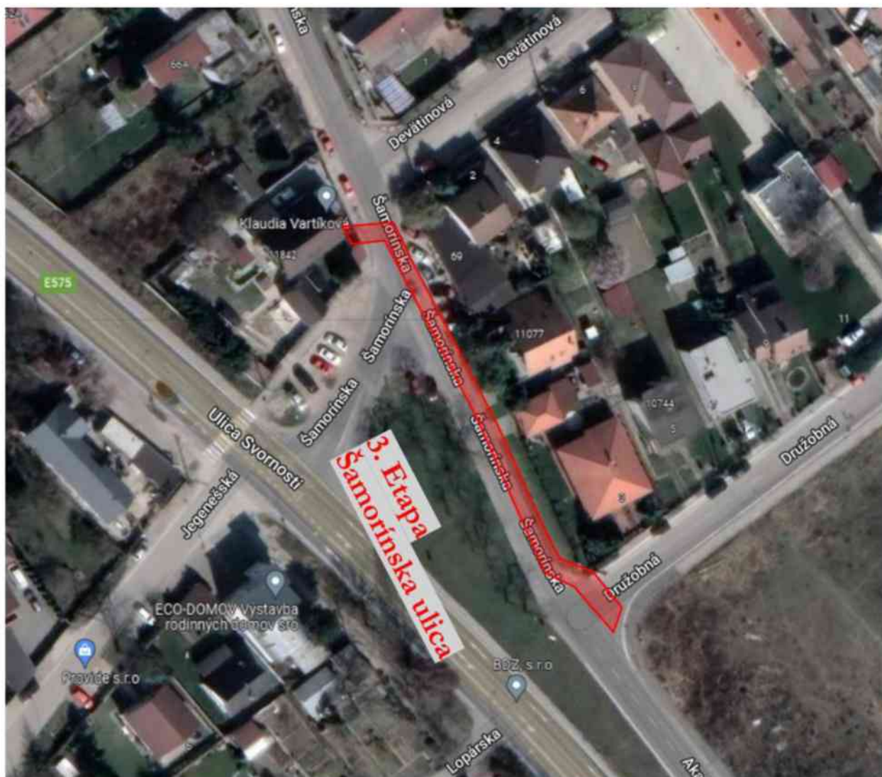
Obrázok 3. Vybudovanie chodníka a bezbariérových priechodov pre chodcov za účelom bezpečného a kontinuálneho prechodu medzi ulicami.