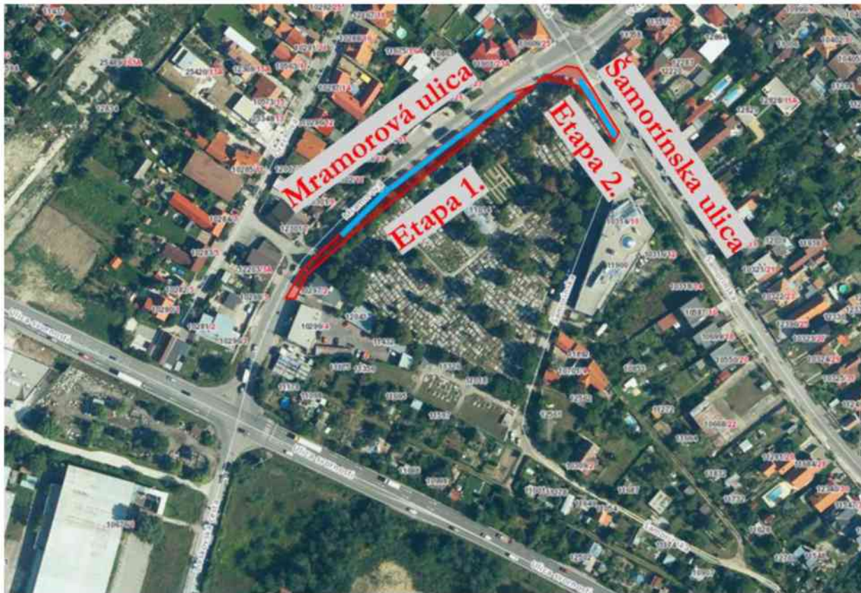
Obrázok 1. Rozdelenie stavby na jednotlivé etapy

Vysvetlenie: zelenou nová plocha pre chodcov, červenou pôvodná plocha pre chodcov