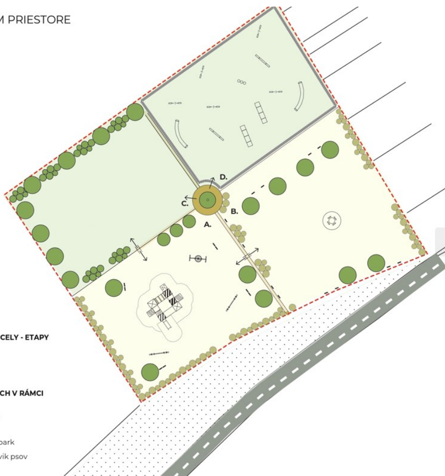
Obr. č. 2: - vizualizácia zámeru tvorby oddychovej plochy

A. detské ihrisko B. ohnisko C. rímsky herný park D. plocha na výcvik psov