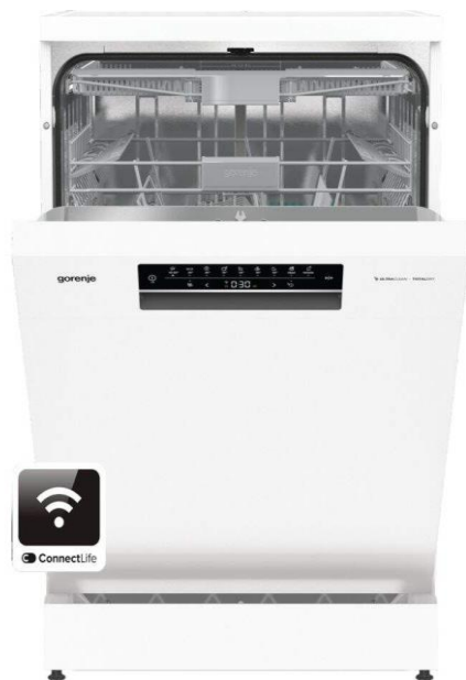
Umývačka riadu – Gorenje