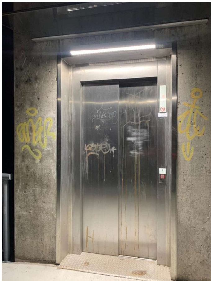
Obrázok 1 – Lávka na Botanickej ulici, výťah, aktuálny stav